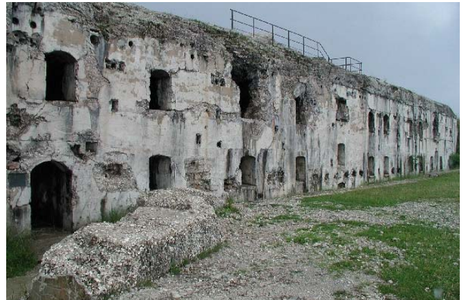
Altes Festungswerk auf der Hochebene