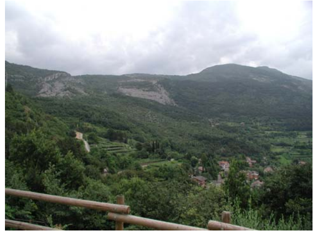
Oberhalb Rovereto in Richtung Zugna-Torta