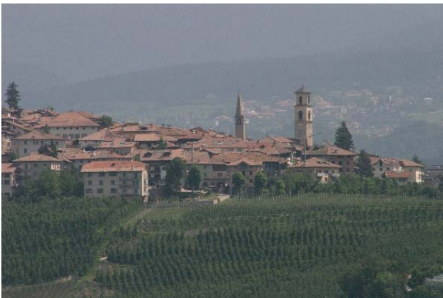
Blick auf Fondo (Nonstal)

Abfahrt, Heimreise durchs Nonstal und den Deutsch-Nonsberg Sanzeno, Wallfahrtsort San Romedio Mittagessen über den Gampenpass nach Lana und Heimfahrt durch den Vinschgau Ankunft in Pettneu