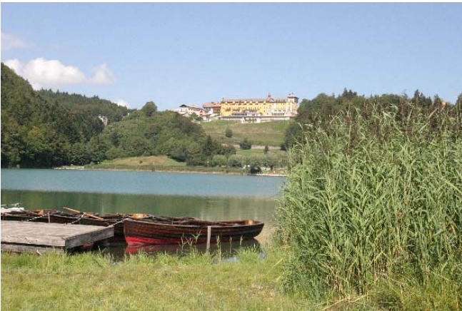
See von Lavarone

Abfahrt in Richtung Hochebene Rundgang durch Lusern mit Besuch des Dokumentationszentrums in Lusern Mittagessen Rundfahrt auf der Hochebene von Lavarone / Folgaria, Serrada, Ankunft in Tenna