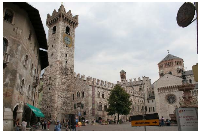
Domplatz in Trient