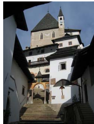
Wallfahrtsort zum Heiligen Romed bei Sanzeno

Reisepass, Personalausweis und wenn vorhanden SENIORENAUSWEIS mitnehmen!