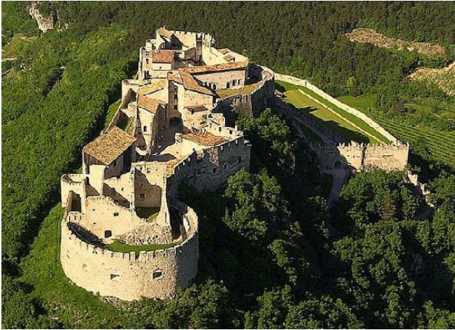
Castel Beseno bei Calliano im Etschtal

Abfahrt Führung im Castel Beseno Mittagessen in Rovereto Stadtführung und -bummel in Rovereto Ankunft in Tenna